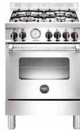
MAS 604 GMFE SXE 60 cm

Forno: elétrico ventilado com 9 funções Queimadores: 5 a gás Largura: 69,5 cm Profundidade: 60 cm Altura: 87,5 a 91,5 cm