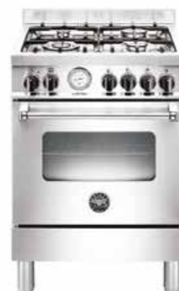
MAS 604 GGEV SXE 60 cm

Forno: a gás ventilado com 5 funções Queimadores: 5 a gás Largura: 69,5 cm Profundidade: 60 cm Altura: 87,5 a 91,5 cm