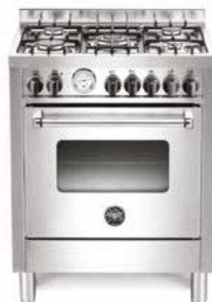
MAS 705 GGEV SXE 70 cm

Forno: a gás ventilado com 5 funções Queimadores: 5 a gás Largura: 89,5 cm Profundidade: 60 cm Altura: 87,5 a 91,5 cm