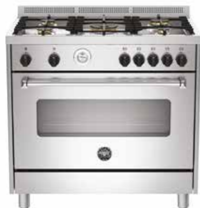
MAS 905 GGEV LXE 90 cm

Forno: elétrico ventilado com 9 funções Queimadores: 4 a gás Largura: 59,5 cm Profundidade: 60 cm Altura: 87,5 a 91,5 cm